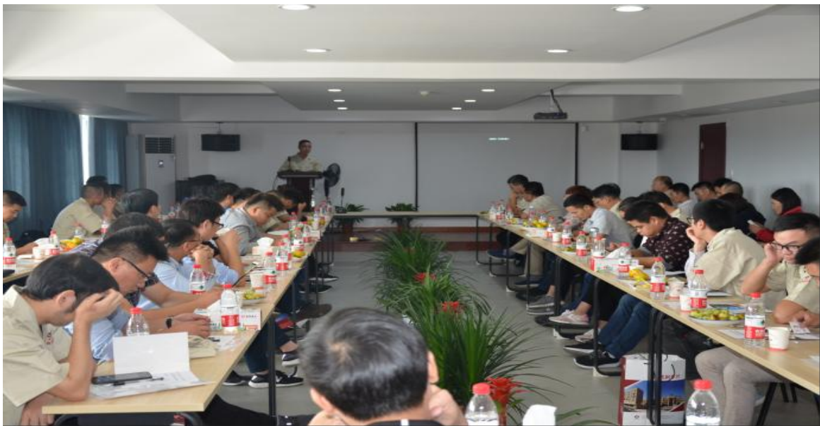
图表 2-2 优纳摩擦员工培训现场

为提升和确保培训的效果，公司对每项培训的效果开展评价、分析和改进。办公室通过座谈或问卷调查的形式与评估对象进行交流，了解培训组织、授课方式、讲课质量等方面的基本数据，掌握培训取得的实际意义和价值，收集关于改进和发展员工培训机制的意见和建议，便于公司对整个培训过程进行综合评价和改进，进一步提高员工培训的整体水平。