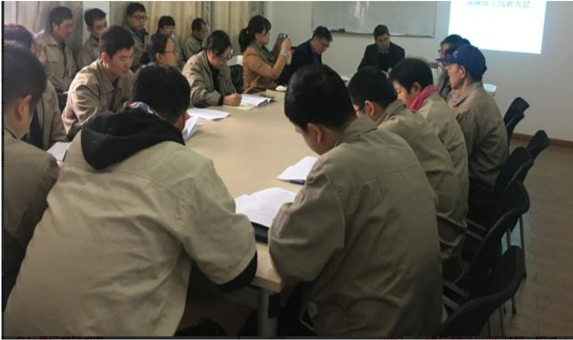
图表 2-5 员工集体活动图